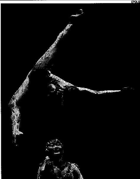
► Due acrobati del Cirque du soleil

DAL CIRQUE DU SOLEIL alle suggestioni musicali ed acrobatiche della compagnia francese Les Farfadais , passando però per decine di mostre e appuntamenti culturali, ospitati dai capoluoghi di provincia. Ogni città, dunque, avrà la sua stella polare. Tutto intorno una nebulosa di eventi tesi a valorizzare il territorio dal punto di vista turistico e a destagionalizzare l'appello del Tacco d'Italia. Oltre ai capoluoghi, anche altre due località accoglieranno artisti e spettatori: si tratta di Castel del Monte e Alberobello, siti tutelati dall'Unesco perché patrimonio dell'umanità. Quale location migliore, del resto, per